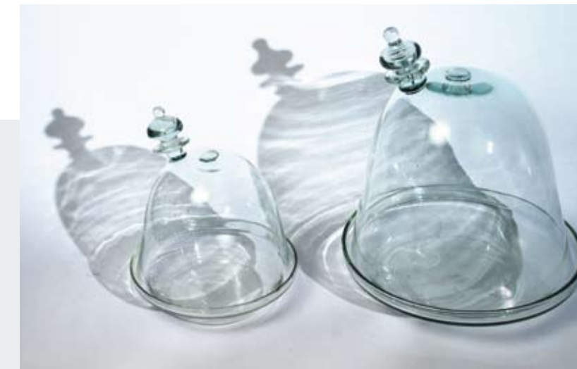
Cloche en verre soufflé du designer Thomax Goux en collaboration avec Tarak Kamoun

L'Office national de l'artisanat a apporté son savoir-faire pour mobiliser des artisans d'excellence dans la démarche et des domaines artisanaux à valoriser (fibres végétales, cuir, verre soufflé, terre cuite, tissage), l'Institut Supérieur des Beaux-Arts a su inscrire le projet dans son programme pédagogique pour permettre à ses étudiants de participer activement aux workshops, l'IFC a mis son expertise à disposition pour identifier les designers internationaux à inviter et Monoprix en jouant le rôle d'éditeur et de diffuseur des objets donne toute son ampleur à l'ensemble.