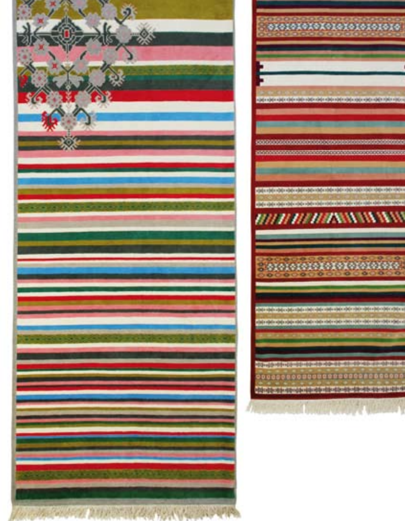
Tapis de la designer Arzu Firuz en collaboration avec le centre 3T