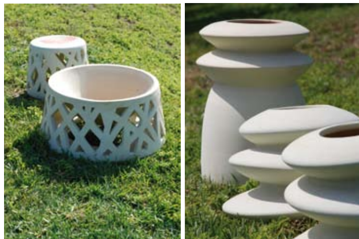
Jarres et mobiliers de jardins en terre cuite du designer Cheick Diallo en collaboration avec Poterie Laajili